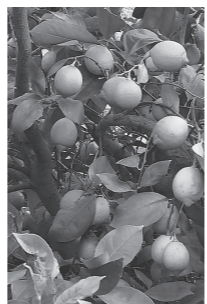
レモンなどを活用した商品開発経費を助成