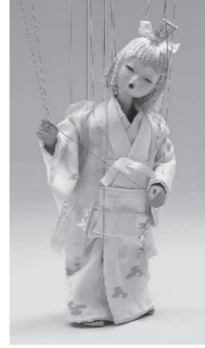
喜之助人形「雪ん子」

喜之助フェスティバル市民実行委員会では、「人形劇の祭典・喜之助フェスティバル」を開催します。