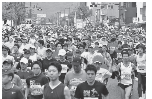
昨年のおかやまマラソン

日間、岡山県総合グラウンド陸上競技場前広場で「おかやまマラソンEXPO 2016」を開催します。 岡山のご当地グルメ、特産品の販売ブースやイベントステージなどで、岡山の魅力を発信しますので、ぜひお越しください。 詳しくは、大会公式ホームページ「おかやまマラソン」で検索)または、県庁、県民局などに備え付けのチラシをご覧ください。 ▽交通規制時間 午前7時45分ごろ～午後3時15分ごろ