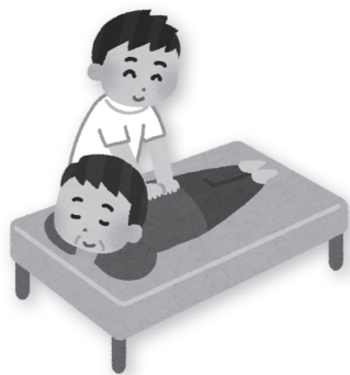
マッサージ目的では健康保険は使えません