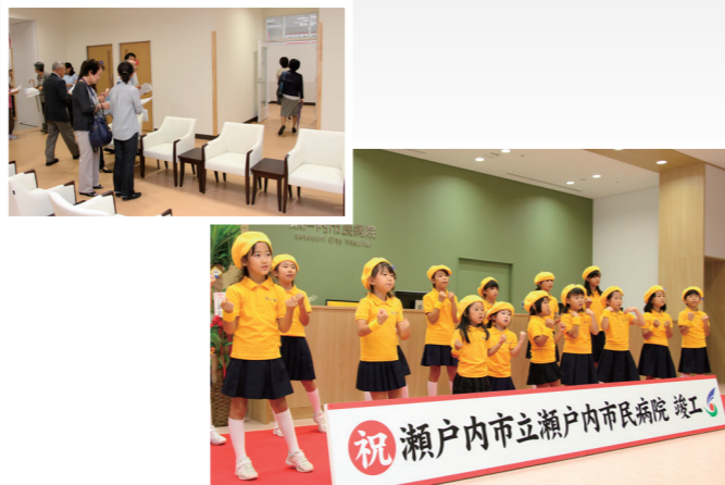
健康管理センターを見学する来場者（左上）／市民病院完成を祝い、歌を歌うせとうちボランティア合唱団「ティンカーベル」（右下）

内覧会では、大勢の関係者や市民らが病院内を回り、最新のMRIをはじめ、手術室やリハビリテーション室などを見学していました。