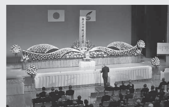
平成27年度戦没者追悼式