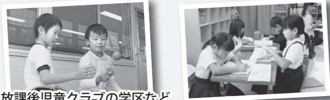
放課後児童クラブの学区など