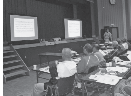
昨年のせとうち防災リーダー研修会

市では、自主防災組織の結成、活動活性化の中心を担う防災リーダーを育成するため、「せとうち防災リーダー研修会」を開催します。 研修会では、地域で防災活動を進めるための知識や技術の習得を目指します。研修を受講した人には、せとうち防災リーダーの証として、修了証などを交付します。 男女問わず、自治会、自主防災組織のリーダー、役員をはじめ、自主防災組織の結成、防災計画作りや防災訓練などに取り組みたいと考えている人、防災知識を深めたい人、防災に関心がある人など、皆さんの積極的な参加をお待ちしています。