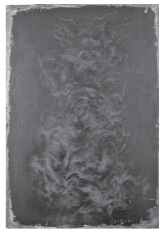
「業火」1970年 高松市美術館

作品の見どころを伝える案内人と一緒に、皆で話し合いながら展示室で鑑賞します。事前申し込みが必要です。 ▽日時 12月4日(日) 午前10時30分~(約60分) ▽対象 小中学生と保護者 ▽定員 10組(25人)程度 ▽参加費 上記の観覧料 【ギャラリートーク】 展示室で作品を鑑賞しながら、作品の魅力を解説します(事前申し込みは不要)。 ▽日時 会期中の日曜日 午後1時30分~(約30分) ▽参加費 上記の観覧料 ▽申込 瀬戸内市立美術館 ☎0869-34-3130