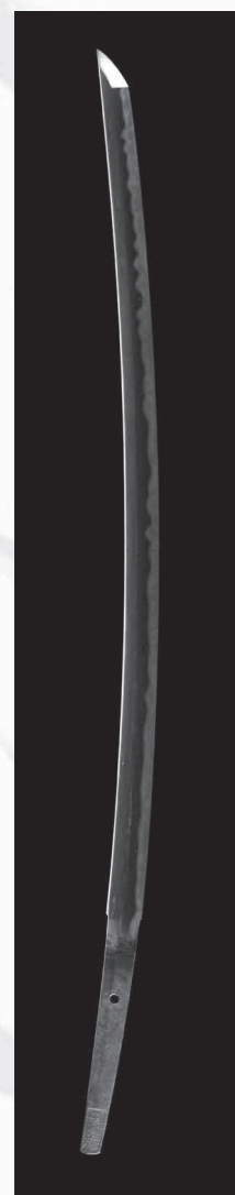
重要文化財 太刀 額銘 吉房 (東郷神社所蔵)

最も有名な作品は「岡田切」と号の付いた御刀で、戦国時代の天正12(1584)年、小牧長久手の戦いの時、織田信長の息子である織田信雄が、裏切りを画策したとして家臣の岡田重孝を斬り伏せたことから名付けられました。