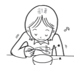
がちゃがちゃと食器の音を立てる