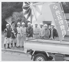
「少しでも地域の人達のお役に立てれば」という思いの人は、ぜひご連絡ください