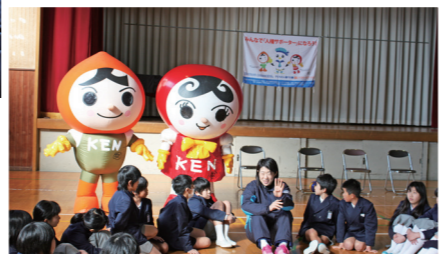
人権イメージキャラクターの人KENまもる君と 人KENあゆみちゃんも選手の話に耳を傾けました