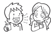
口に食べ物が入ったままおしゃべりする