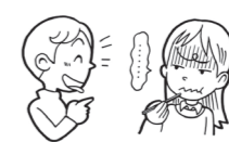
食事中にふざけたり話をする