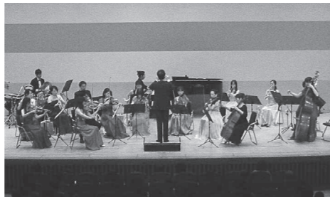
岡山フィルハーモニック管弦楽団