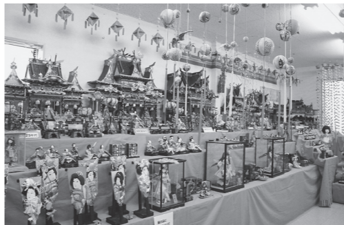
平成27年のおひなさまフェスタ

着物を使っておひなさまを 作る体験コーナーやぜんざいの 無料接待もあります。リサ イクルを考えながら、桃の節 句を一緒に楽しみましょう。 場所 リサイクルプラザ・おく (邑久町尾張483-6) 【おひなさまフェスタ】 日時 2月28日(日) 午前9時～午後3時 参加費 無料