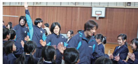
児童と交流を深める 岡山シーガルの選手たち

5・6年生約100人の児童は、シーガルの選手 から、人を思いやる気持ちの大切さなどバレーボ ール選手としての経験に基づいた話を聞いた後、プロ のバレーボール技術の実演を見学し、その迫力に目 を丸くする場面も。また、児童と選手らは一緒にレ クリエーションを行い、交流を深めていました。