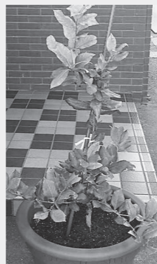
成長したレモンの苗木

瀬戸内市発ブランドは、瀬戸内市の「美しさ」をブランドコンセプトとし、「Setouchi Kirei (セトウチキレイ)」と表現しています。