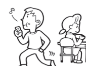
食事中に席を立つ