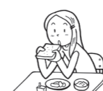
肘を突いて食べる