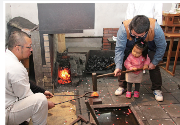
重い槌を振り下ろし、玉鋼を打つ参加者

1月10日、備前おさふね刀剣の里(長船町長船)で、 1年の精進と無事故を祈る打初式を行い、刀匠が火床に 新年最初の火をおこしました。