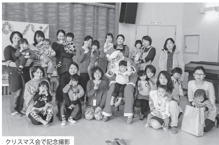
クリスマス会で記念撮影