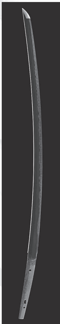
太刀 銘 光忠 (佐竹家伝来)