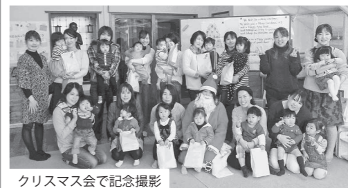
クリスマス会で記念撮影