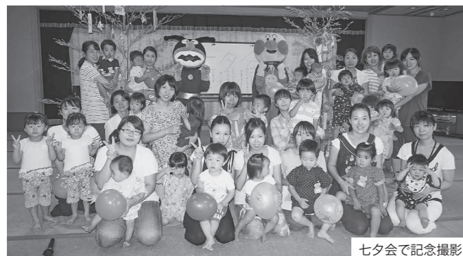
七夕会で記念撮影