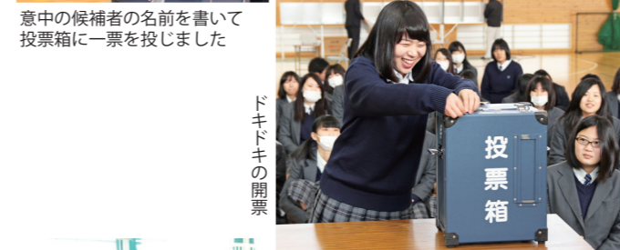
意中の候補者の名前を書いて投票箱に一票を投じました