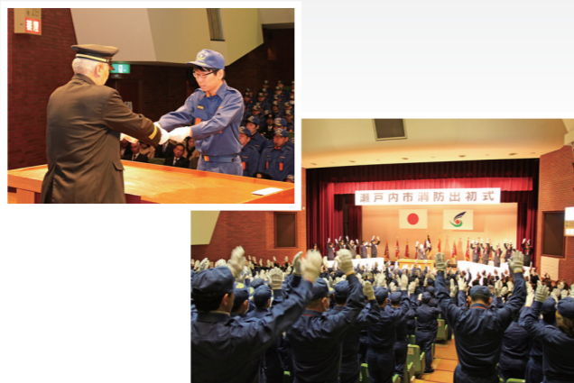
辞令を受ける新入団員（左上）／市消防の発展を願い、万歳三唱（右下）