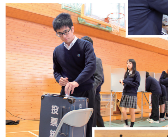
初めて投票用紙を受け取る生徒ら