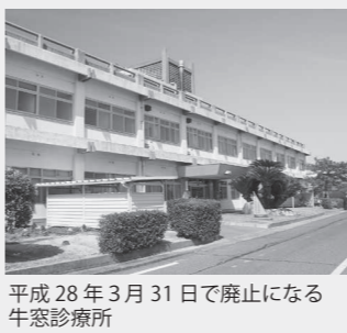
平成28年3月31日で廃止になる牛窓診療所