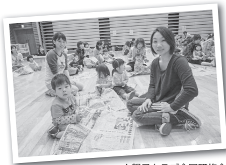
▲親子クラブ合同研修会