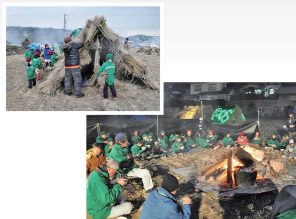
わらや段ボールを集めて家づくり（左上）／保護者の皆さんが作ったおでんと炊き込みご飯で夕食（右下）

1月23日、邑久町山田庄の田んぼで瀬戸内市 FOS 少年団連盟が耐寒キャンプを行いました。