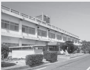
平成28年3月31日で廃止になる牛窓診療所