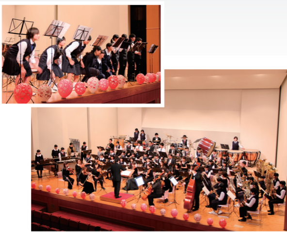
打楽器隊によるボディ・パーカッション(左上) / 市内3中学校吹奏楽部と岡山フィルハーモニック管弦楽団の合同演奏(右下)

岡山フィルハーモニック管弦楽団との合同演奏では、演奏の合間に岡山フィルハーモニック管弦楽団の演奏者が吹奏楽部の生徒に声を掛ける場面も。最後は全員が舞台に集い、「サウンド・オブ・ミュージック」と「ふるさと」を披露。その美しい演奏に来場者から大きな拍手が送られました。