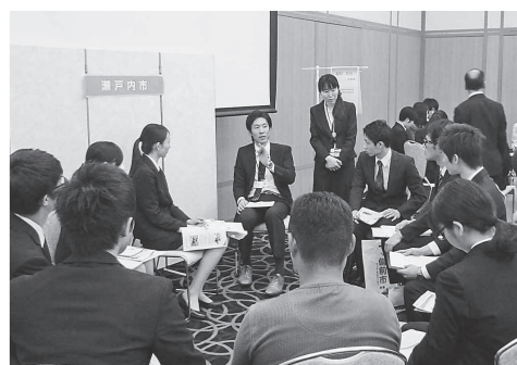
昨年の合同説明会

▽日時・場所 ・5月14日(土) 午後7時～中央公民館(邑久) ・5月21日(土) 午後7時～ゆめトピア長船 ・5月28日(土) 午後7時～牛窓町公民館 ▽議会事務局 ☎0869・22・0979