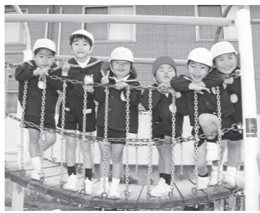
みんな遊びに来てね!