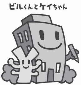
経済センサスキャラクター