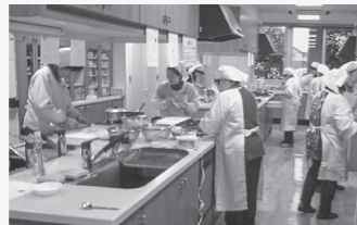
栄養バランスを考えて調理実習!

▷日時 5月19日（木）～平成29年2月16日（木） 毎月第3木曜日（10回コース） 午前9時30分～午後0時30分 ▷場所 ゆめトピア長船 ▷内容 健康に関する講話、栄養バランスのとれた調理実習 ▷対象者 市内在住の人