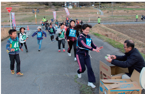
だがしウオーラリーのチェックポイントで駄菓子に駆け寄る子どもたち