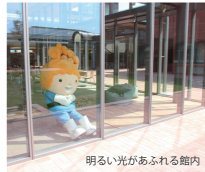
明るい光があふれる館内

この図書館を以前からあった公民館とオリーブの庭で囲みながら、輪が広がっていくようにつくられたこともうれしいことでした。この図書館によって、皆さんの心と人の輪が、ますます大きく豊かに広がっていくことを願っています。