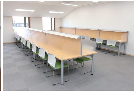
スタディールーム