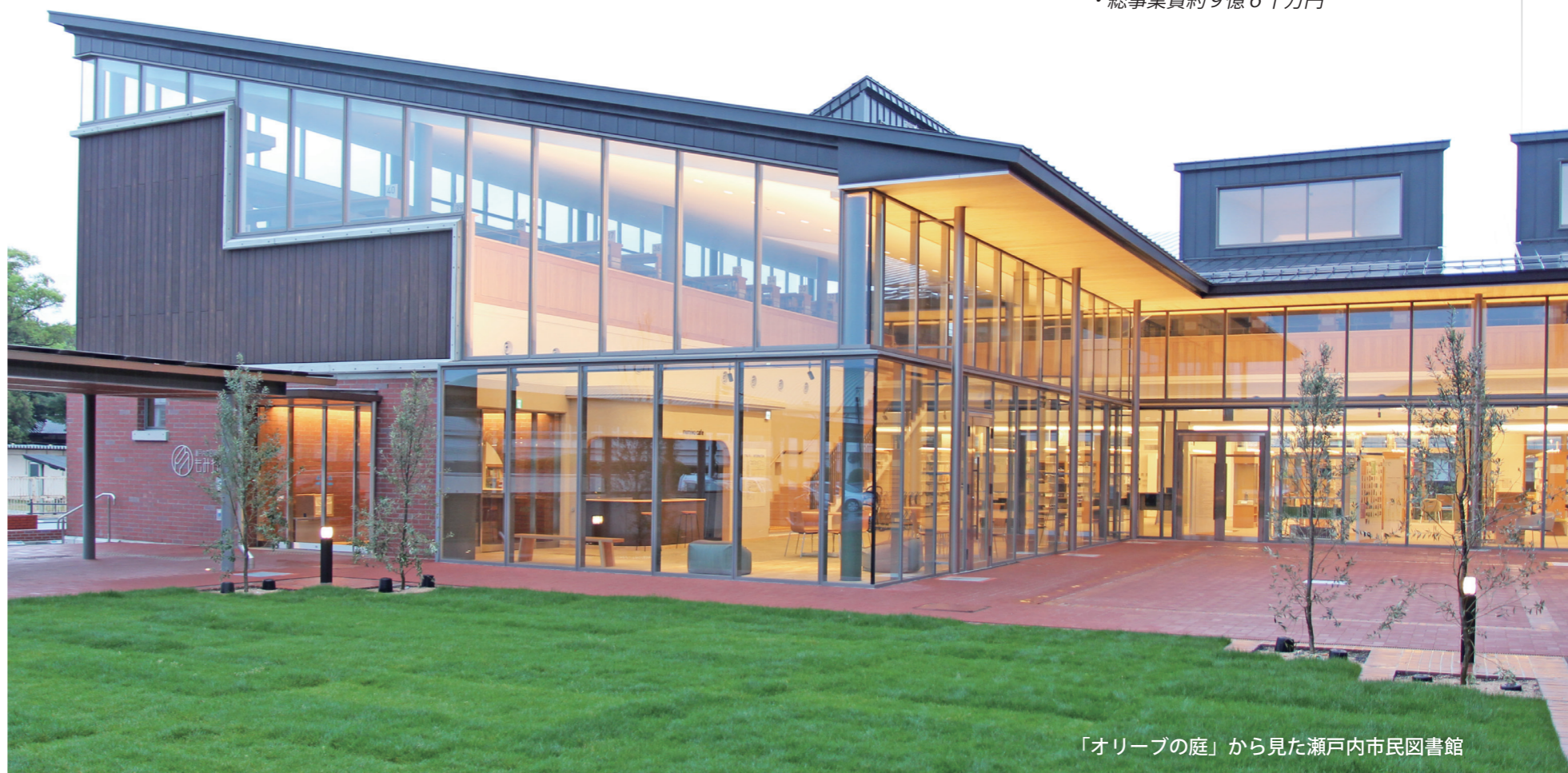
「オリーブの庭」から見た瀬戸内市民図書館