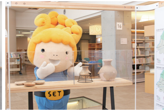
せとうち発見の道