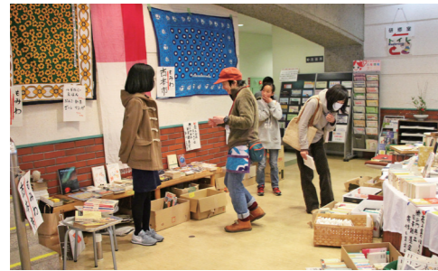
BOOK ブックこんにちわ! 「本と人が出会う未来の図書館フェスティバル」として開催されたイベント