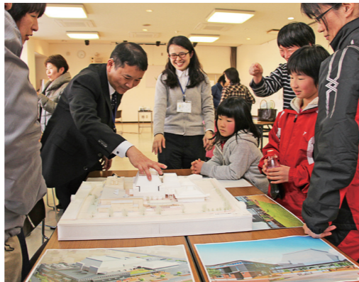
としょかん未来ミーティング 計10回開催され、市民と対話を重ねながらより機能的な図書館づくりを進めました 【写真 新図書館の模型の説明を受ける参加者】

と しょかん未来ミーティングでは、幅広い層の人が参加されて、こんな図書館にしてほしいという希望や、図書館の職員では気付かないような新しい意見も出ました。それを汲み上げて、この図書館ができたことはとても素晴らしいことだと思います。赤ちゃんからお年寄りまでの居場所がある図書館ができて、とてもうれしく思っています。市民の皆さんがこの図書館で集い、「もみわ広場」が発展することを願っています。