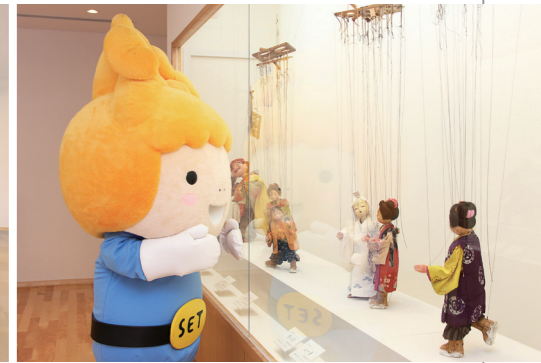
喜之助ギャラリー

インターネットコーナー インターネットが利用できるパソコンを8台設置しています。ネット検索のほか、新聞記事や法律情報などを検索、閲覧、印刷できる商用オンラインデータベースも利用できます。