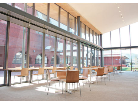
明るいカフェカウンター