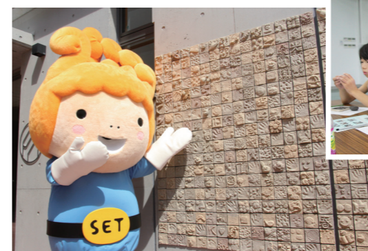
寒風としよかんタイルプロジェクト