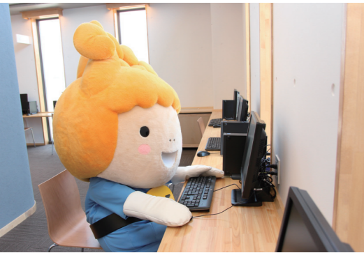
インターネットコーナー