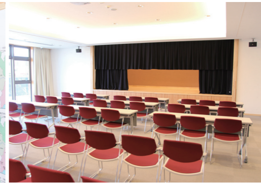
つどいのへや／喜之助シアター