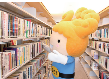
お目当ての本を探すセットちゃん