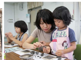
市民の皆さんが思いを込めて作ったタイルが飾られています

寒風としよかん タイルプロジェクト 寒風陶芸会館と連携し、備前焼発祥の地といわれる寒風の土を使った手づくりタイルが図書館南側の壁面を飾っています。 子どもからお年寄りまで3,000人余りの市民の皆さんが思い思いにデザインし、作ったタイルが壁材として使われています。