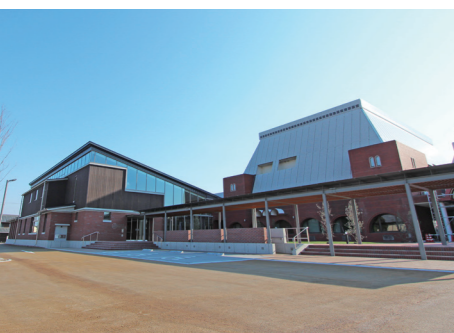
中央公民館（写真右）と併設の図書館