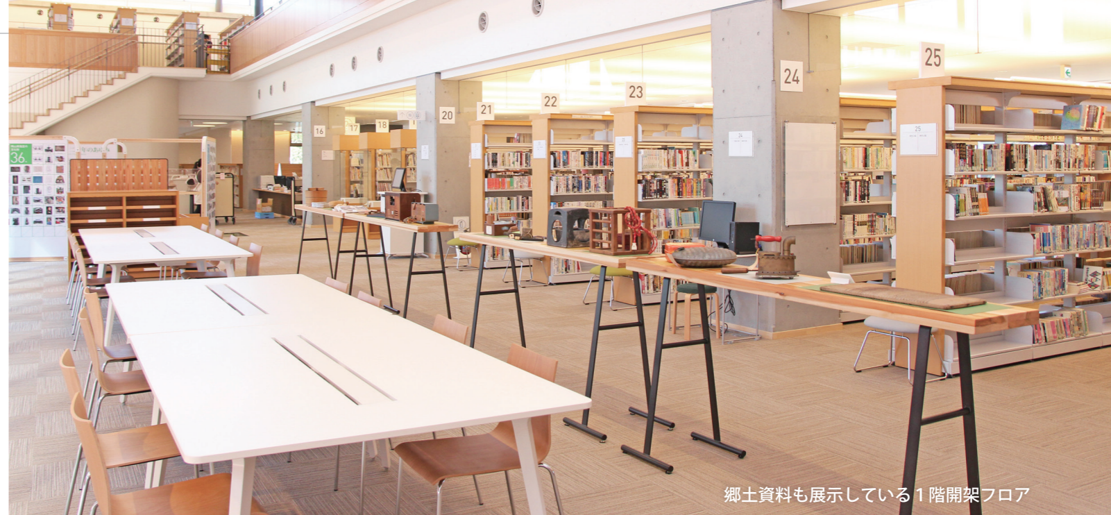
郷土資料も展示している1階開架フロア

と しょかん未来ミーティングでは、幅広い層の人が参加されて、こんな図書館にしてほしいという希望や、図書館の職員では気付かないような新しい意見も出ました。それを汲み上げて、この図書館ができたことはとても素晴らしいことだと思います。赤ちゃんからお年寄りまでの居場所がある図書館ができて、とてもうれしく思っています。市民の皆さんがこの図書館で集い、「もみわ広場」が発展することを願っています。