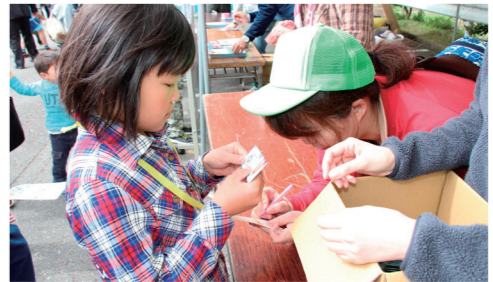
働いた後、給与「ユリイカ」を受け取る参加者

長船スポーツ公園で4月29日、さまざまな仕事体験ができる子ども向けのイベント「キッズワークゆりいかinせとうち2016」が開催されました。 これは、10年後の瀬戸内市を明るく住みよいまちにするため、子どもたちに稼ぐことの重要性や働くこと、仕事への魅力を感じてもらうことなどを目的に、瀬戸内市商工会青年部の主催で初めて実施したものです。 市内の飲食店や警察署、病院などが計24ブースを設置し、子どもたちは自分が体験してみたい仕事を選び体験することで、しみながら、働くことへの理解を深めていました。仕事後は、各ブースで使える給与「ユリイカ」が支払われ、その都度税金を納めていました。