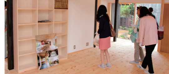
大市を盛り上げた名刀太鼓の演奏(左上) / 1日限定で公開された築260年の古民家再生住宅(右下)