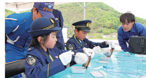
警察官の体験で指紋を採取