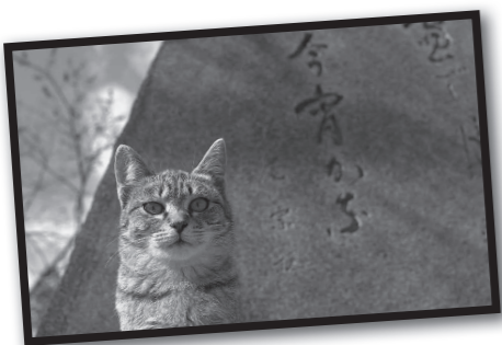
△森原輝明「牛窓の猫」(牛窓で撮影)