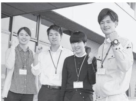
皆さんからのご応募お待ちしております