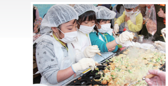
たこ焼き屋の体験