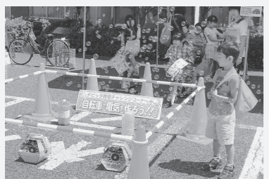
△昨年の環境フェスタ