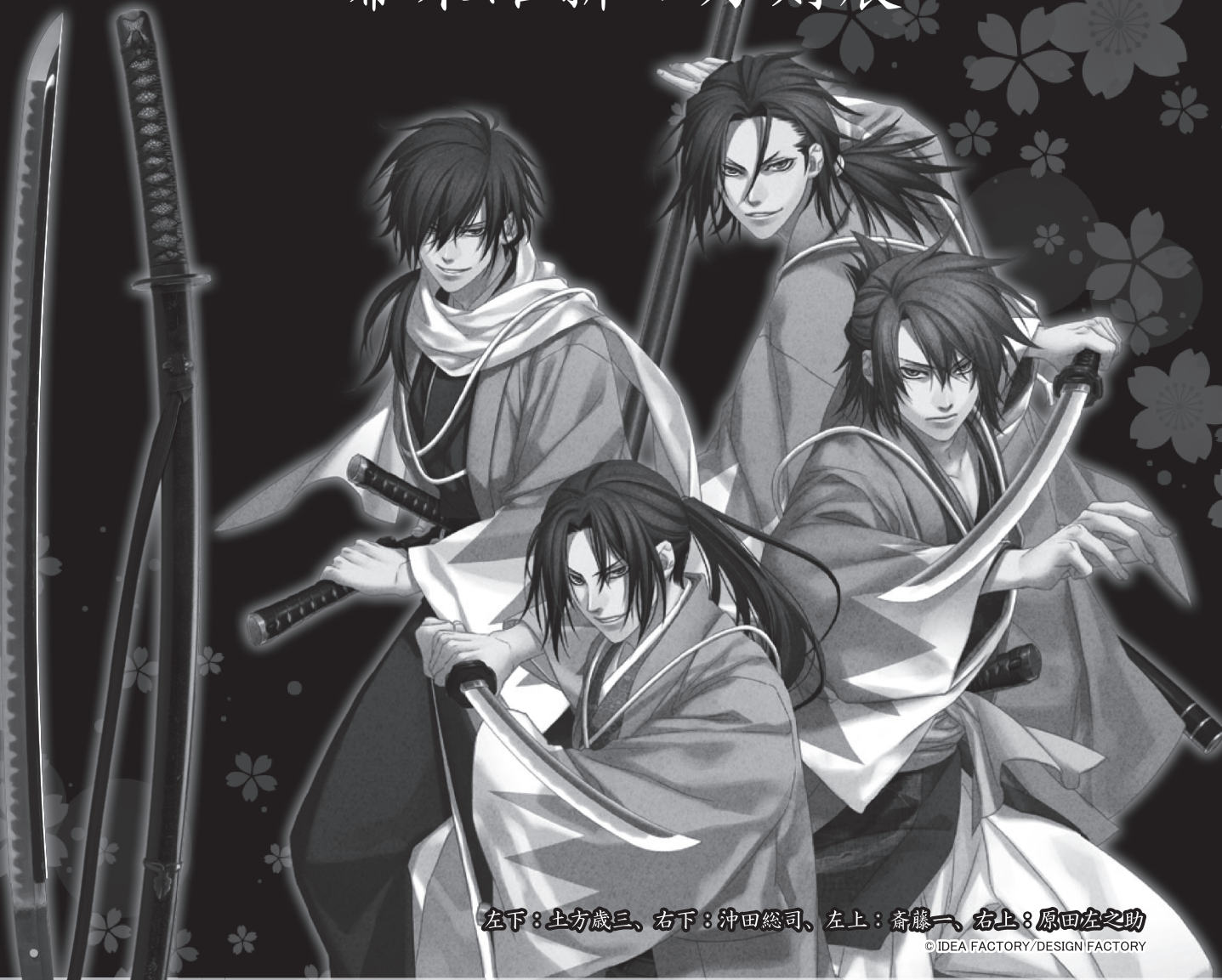
左下：土方歳三、右下：沖田総司、左上：斎藤一、右上：原田左之助

館内の展示作品を解説します。約1時間(おおよその希望の時間に合わせます)、無料(要予約、1週間前まで)。