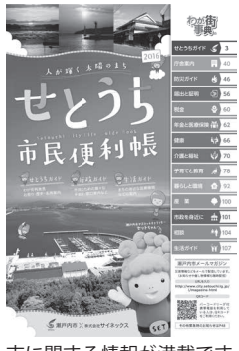
市に関する情報が満載です

「せとうち市民便利帳」は、市役所での各種手続きなどの行政情報や観光・歴史などの地域情報を掲載した、生活に役立つ市に関する情報をまとめた冊子です。