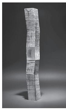
「Monolith - Blue Mist - 2009」 （磁器・銀滴彩（ぎんてきさい）・キャストガラス）

陶を原点にしながらも、ガラスや銀などさまざまな素材や技法を駆使し、新たな表現を模索し続ける近藤が手掛ける水の宇宙、再生と浄化の世界をご体感ください。