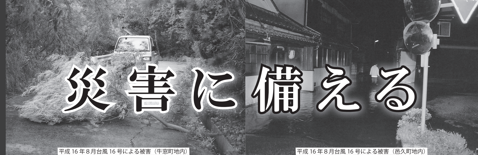
平成 16 年 8 月台風 16 号による被害（牛窓町地内）