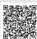
携帯電話用 QR コード

災害時には、避難情報のほか、道路の通行止め情報などを配信しています。また、市のイベント情報なども配信しています。