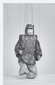
喜之助人形「千歳（せんざい）」

喜之助フェスティバル市民実行委員会では、「人形劇の祭典 瀬戸内・喜之助フェスティバル」を開催します。