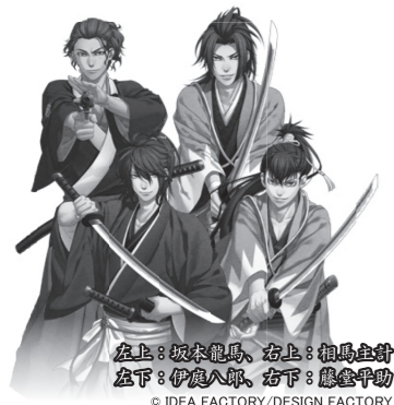
左上：坂本龍馬、右上：相馬主計 左下：伊藤八郎、右下：藤堂平助 © IDEA FACTORY/DESIGN FACTORY

また、さまざまな事件に関わった刀剣から、懸命に生きた武士の「心」を感じ、現代にもつながる伝統工芸の「技」の結晶である日本刀をご覧ください。