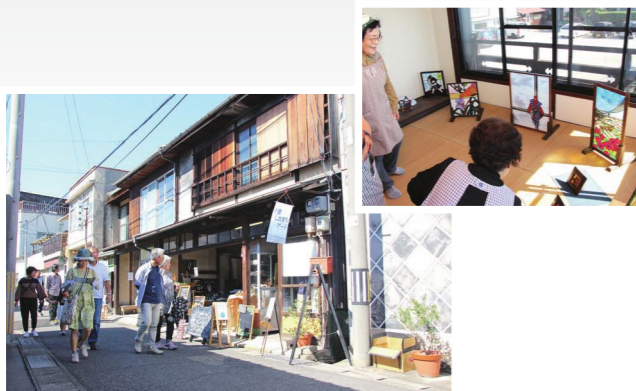
古い町並みが残る牛窓を散策する来場者（左下）／ステンドグラスなどさまざまなジャンルの作家が出展（右上）

9月29・30日と10月1日の3日間、しおまち唐琴通り（牛窓町牛窓）の古民家を会場に使った「2017牛窓しおまちアート」が開催されました。