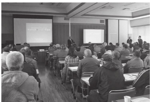
昨年のせとうち防災リーダー研修会

研修会では、地域で防災活動を進めるための知識や技術の習得を目指します。研修を受講した人には、せとうち防災リーダーの証として、修了証などを交付します。