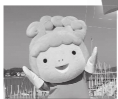
セットちゃんの順位 （ご当地ランキング） 39位（10月17日現在）

ゆるキャラグランプリ公式 HP HP http://www.yurugp.jp/ HP 秘書広報課 ☎0869-24-7095