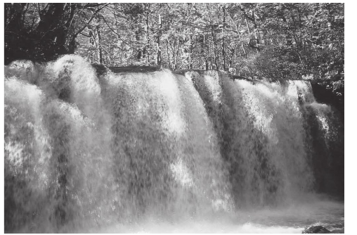
緑川洋一「秋の奥入瀬大滝―十和田八幡平国立公園―」

瀬戸内市ゆかりの写真家・緑川洋一(1915・2001)は、「色彩の魔術師」と呼ばれるほどの高い撮影・現像技術によって、自然の風景を独自の色彩で表現しました。緑川は海外での経験を経て、変化に富んだ自然と風土、繊細な季節の移ろいをもつ日本の風景写真を志向していきます。