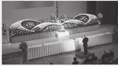
平成28年度戦没者追悼式

ご遺族の皆さんの出席をお願いします。 ▷日時 11月10日(金) 午前10時～ ▷場所 ゆめトピア長船 ▽福祉課 ☎0869・26・5941