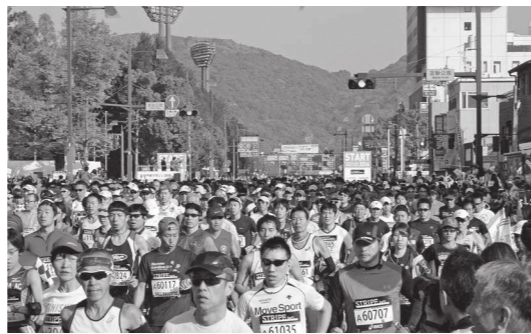
おかやまマラソン

大会当日は、コースと周辺道路において最大7時間30分にわたる交通規制を行うため、交通渋滞が予想されます。