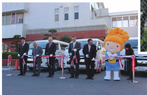
関係者らによるテープカット（運行開始式）