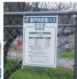
市営バスの乗り場に付けられた時刻表

運行開始日の前日には、市営バスの運行が安全かつ確実に行われることを願い、瀬戸内市役所で瀬戸内市営バス運行開始式が行われました。