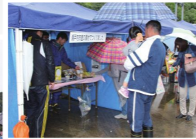
地元産品の販売コーナー