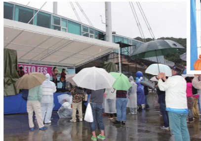
雨の中、盛り上がった音楽ライブ

会場では、音楽ライブやラジオの公開録音、地元産品の販売コーナーなどがあり、来場者は雨の中、思い思いに楽しい時間を過ごしました。