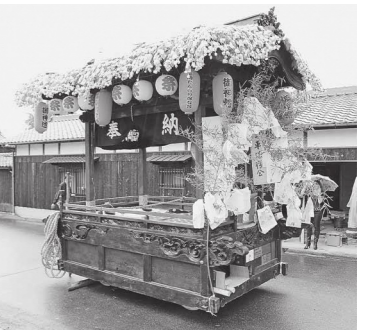
修繕された福岡だんじり

福岡連合町内会が、平成29年度のコミュニティ助成事業を活用し、福岡だんじり(市指定有形民俗文化財)を修繕しました。