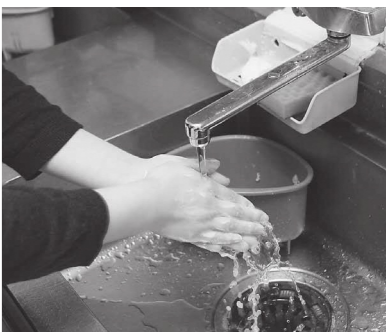
十分な流水で手を洗いましょう