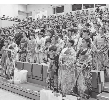
平成29年瀬戸内市成人式