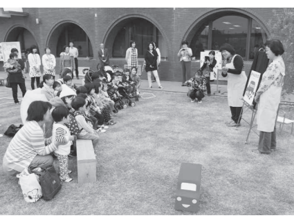
瀬戸内市民図書館の前で開催されたミニプレーパーク「パーク&カフェ」

今後は、ワークショップやセミナーで出された意見や子育て中の保護者へのアンケート調査結果などを踏まえて、子育て広場の指針となる基本構想を策定します。