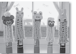
出来上がった指人形