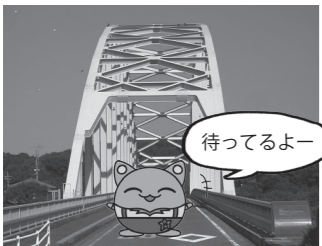
邑久長島大橋「人間回復の橋」