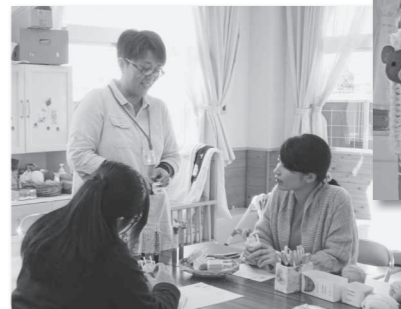
マタニティ教室で赤ちゃんへのプレゼントを作りました

困っていることや悩んでいることがあるれば、お気軽にご相談ください。 なお、相談日は、子育て支援センター便りでお知らせしています。