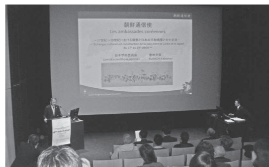
パリ日本文化会館で開催された朝鮮通信使セミナー

の関係資料の展示会、レセプションを開催するとともに、パリ日本文化会館では朝鮮通信使セミナーを開催しました。セミナーでは、日韓共同で記憶遺産に申請する意義や善隣友好の精神をお伝えすることができました。