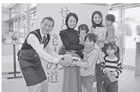
瀬戸内市民図書館 10万人目の来館者に記念品が手渡されました (12月11日)

図書館運営のさまざまな局面で、市民の皆さんと意見交換をし、協働で事業を実施するなど、「新図書館整備実施計画」に掲げた図書館づくりを展開するために、ぜひ多くの市民の皆さんにご参加をいただければと考えています。