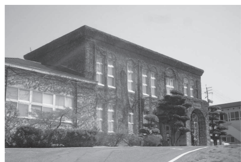
国の登録有形文化財への登録を目指す長島愛生園の歴史館