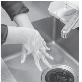
指の間まで丁寧に洗いましょう