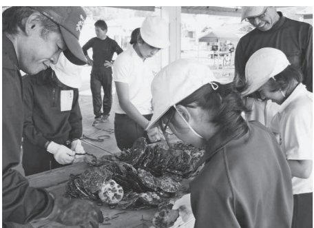
カキの種付け体験を行う裳掛小学校の児童ら

今後も、各学校が地域の状況に応じて、特色ある教育活動が行えるよう支援していきます。