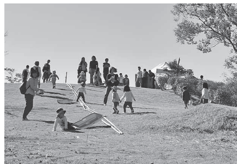
邑久スポーツ公園で開催されたプレーパーク

子どもの遊びは、子どもの生きていく力につながります。特に、「外遊び」は、子どもの五感を刺激し、子どもの発育にとって必要不可欠といわれています。