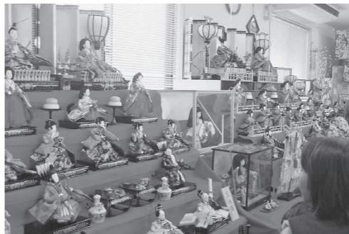
平成28年のおひなさまフェスタ