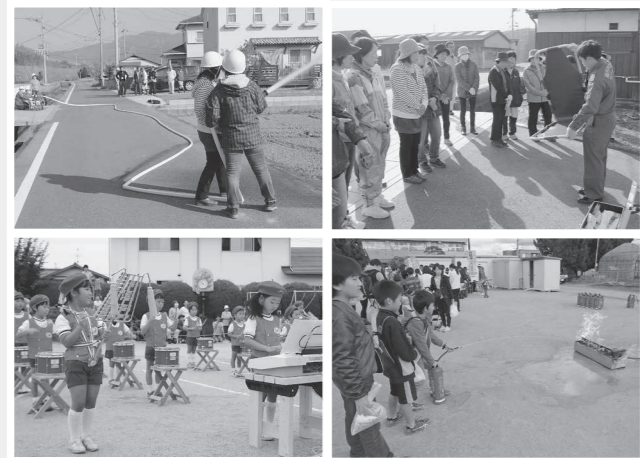
軽可搬消防ポンプの放水訓練(左上) / 担架の取り扱い訓練(右上) / 鼓笛隊セットで演奏する長船西保育園幼年消防クラブ(左下) / 模擬消火訓練装置を使用した訓練(右下)

市では、宝くじの社会貢献広報事業として(一財)自治総合センターが行う「コミュニティ助成事業」を活用し、防火防災備品などを整備しました。