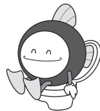
下水道マスコットキャラクター「スイスイ」

市内を流れる河川の水質改善など、市の良好な環境を守っていくため、ご協力をお願いします。