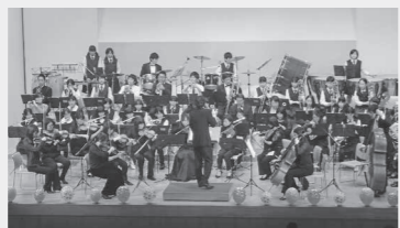
昨年の合同演奏会