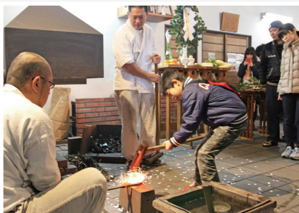
重い槌を振り下ろし、玉鋼を打つ来館者

1月8日、備前おさふね刀剣の里（長船町長船）で、1年の精進と無事故を祈願する打初式を行い、刀匠が火床に新年最初の火をおこしました。