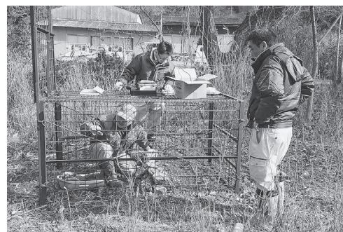
有害鳥獣捕獲の罠設置

表される情報化社会の進展に伴い手軽に金銭の授受が可能となったことによるものです。また、従来の高齢者を狙った振り込め詐欺も後を絶たな