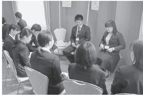
昨年の合同説明会の様子

市職員採用合同説明会を行います 瀬戸内市、玉野市、備前市、赤磐市では、次のとおり職員採用合同説明会を行います。 参加費無料、事前の申し込みは不要です。面接などは行いません。普段着でお越しください。 また、採用説明会への参加の有無が選考に影響することはありません。 ▽日時 5月3日(水・祝) 午後1時～午後4時45分 ▽場所 サンビーチOKAYAMA (岡山市北区駅前町2-3-31)