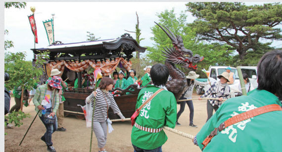
地域の人たちに引かれ、練り歩く豊安だんじり