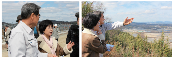
ハビタットを見学中（左）／牛窓オーリーブ園からもメガソーラー建設地を見学（右）