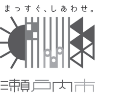
シビックプライド推進事業ロゴマーク

このロゴマークは、「まっすぐ、しあわせ。」というキャッチコピーで未来に向けて市民の幸福を誠実に追求し