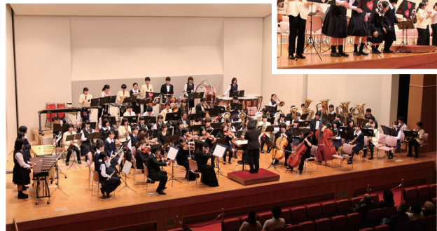
3中学校吹奏楽部と岡山フィルハーモニック管弦楽団の合同演奏（左下）／打楽器隊によるボディ・パーカッション（右上）