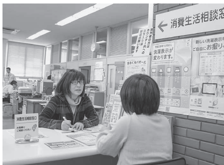
現在の消費生活相談窓口

開設に当たり、専用電話を設置し、より相談しやすい体制づくりに努め、被害の防止と解決に資する機関としての機能の充実を図りたいと考えています。