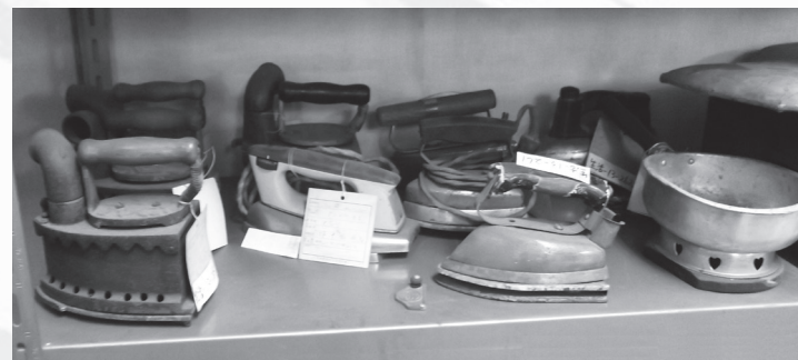
アイロンなどの民俗資料

大正時代には、電気式アイロンが出てきました。最初は温度の調節ができませんでしたが、温度調節機能やスチーマ機能などが付き、便利になりました。