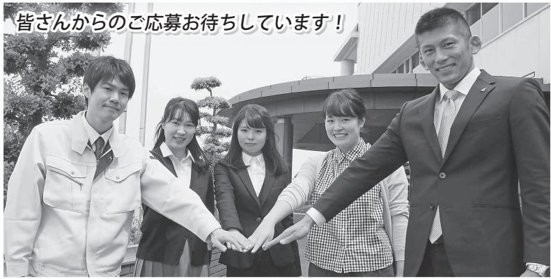
皆さんからのご応募お待ちしております!

名を明記したA4サイズの返信用封筒(120円切手を貼付)を同封して、総務課へ送付してください(●●希望)と朱書きし、「保育士・幼稚園教諭」。