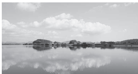
一人一人の心掛けて美しい水環境を守りましょう