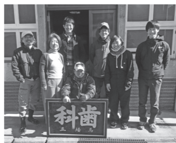
「ウシマド町家スタイル」の皆さん

そのような中、移住だけではなく、事業を行いたい(店を出したい)という希望も数多くあると聞き、地域の人や空き家管理事業者、I-JUコンシェルジュなどと連携し、「ウシマド町家スタイル」を結成して、空き家を改修し、事業者を誘致する取り組みを始めました。