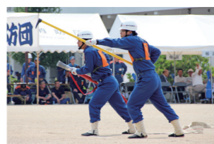
放水態勢の1番員と2番員