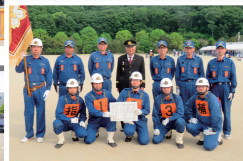
6位入賞を果たした長浜分団の皆さんを囲んで