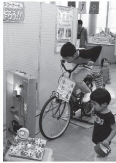
△昨年の環境フェスタ

環境フェスタ inせとうち 瀬戸内市消費生活問題研究協議会、瀬戸内市、備前県民局の共催で「環境フェスタ inせとうち」を開催します。「環境」と「食」をテーマとして、フードコーナー、エコ工作、ごみ分別クイズ、かるたなど、大人も子どもも環境について楽しく学べる内容