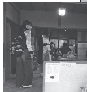
牛窓クラフトコンプレックス