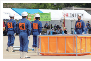
訓練に入る選手ら

選手らは号令とともに機敏な動きを披露するなど日頃の訓練の成果を發揮し、見事6位入賞を果たしました。