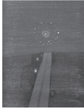
清宮眞文「行手の花火」1981年

日(月)、7月3日(月)、10日(月)、18日(火) せとうちオバケ芸術祭 お化け人形師・中田市男と 妖怪造形師・武本大志