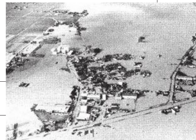
昭和51年9月台風17号による被害（長船町内、干田川流域の氾濫）

ハザードマップは、市役所（危機管理課）、牛窓・長船支所、裳掛出張所で配布しています。また、市ホームページでも確認できます。