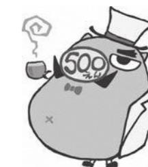
メタボ予防&特定健診PRキャラクター ゴヒャク・デ・ウケール

40～74歳の瀬戸内市国民健康保険被保険者を対象にした「特定健康診査（ワンコイン健診）」は、6月から好評実施中です。平日、仕事などで忙しく受診が難しい人に、休日に受診することができる健診をご紹介します。以下の3つの健診から選んで受診してください。