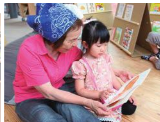
子どもたちは、自分の好きな絵本を読んでもらっていました