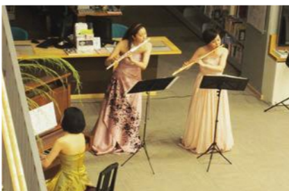
フルートデュオとピアノによる美しい音色が図書館内に響き渡りました