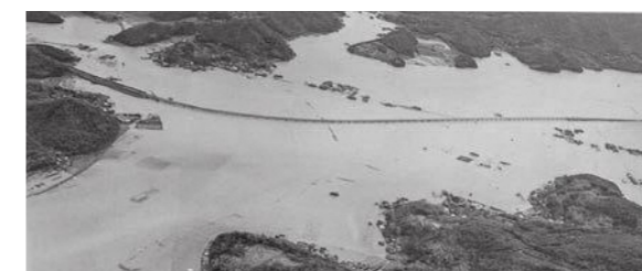
平成2年9月台風19号による被害（邑久町尾張・本庄地区）

東日本大震災では、自宅にいる家族とともに避難しようとして、地震発生後に勤務先や外出先からいったん自宅（津波の浸水域）に戻るといった行動が確認されています。