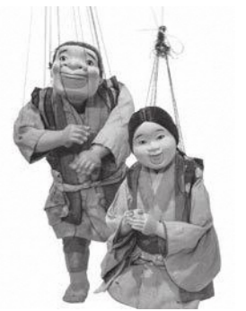
喜之助人形「おとと・おかか」

★当日 ・3歳~中学生700円 ・高校生以上1,200円 ▽前売発売期間 7月21日(金)~8月18日(金) ▽前売取り扱い窓口 中央公民館(邑久)、瀬戸内市民図書館、牛窓町公民館、長船町公民館、ゆめタウン邑久店、ハローズ邑久店 喜之助フェスティバル市民実行委員会 ☎090-8247-4680