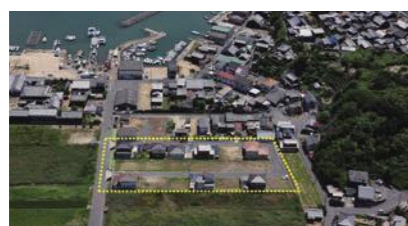
分譲中の東町ひまわり団地