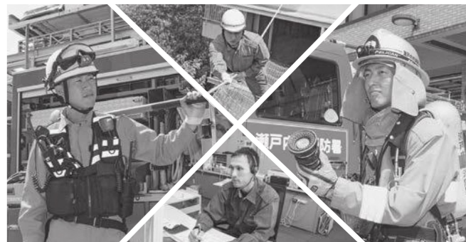
皆様のご応募お待ちしております!

消防職員を募集 市では、次のとおり消防職員を募集します。 ▽内容職種 消防業務 ▽受験資格 高等学校卒業程度以上(卒業見込み含む)の学歴を有する人 ▽提出書類 消防本部指定の受験申込書 ※受験申込書は瀬戸内市役所、支所、瀬戸内市消防本部、分駐所で配布します。また、市ホームページ(消防本部ページ)からダウンロードできます。