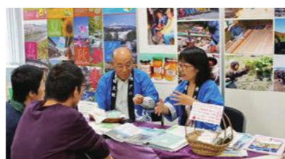
移住フェア（大阪）で移住を呼び掛ける 裳掛地区コミュニティ協議会の皆さん