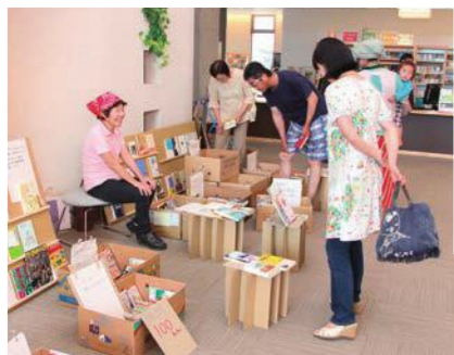
売上金の一部が瀬戸内市民図書館基金に寄付される古本市