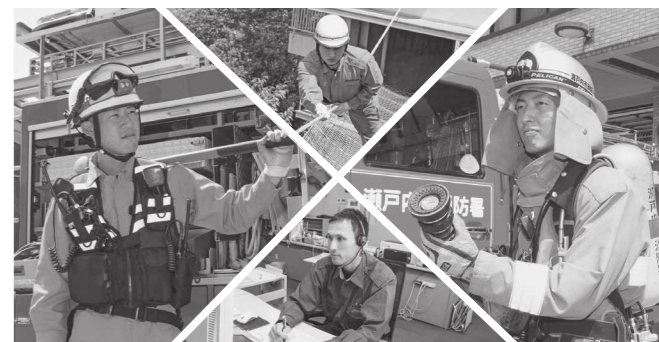
皆様のご応募お待ちしております!

午前8時30分～午後5時(土・日曜日、祝日を除く) ※郵送の場合は9月1日(金)必着です。 ▽提出書類 消防本部指定の受験申込書 ※受験申込書は瀬戸内市役所支所、瀬戸内市消防本部、分駐所で配布します。また、市ホームページ(消防本部ページ)からダウンロードできます。 ☎0869-22-1334 HP http://www.city.setouchi.lg.jp/