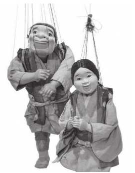
喜之助人形「おとと・おかか」

★当日 ・3歳~中学生700円 ・高校生以上1,200円 ▽前売発売期間 7月21日(金)~8月18日(金) ▽前売取り扱い窓口 中央公民館(邑久)、瀬戸内市民図書館、牛窓町公民館、長船町公民館、ゆめタウン邑久店、ハローズ邑久店 喜之助フェスティバル市民実行委員会 ☎090-8247-4680