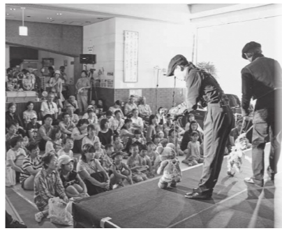
昨年の瀬戸内・喜之助フェスティバル

★前売 ・3歳~中学生500円 ・高校生以上1,000円 ▽観劇料(2歳以下は無料) ▽観劇料(2歳以下は無料) ★前売 ・3歳~中学生500円 ・高校生以上1,000円