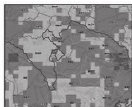
大雨警報（浸水害）の危険度分布