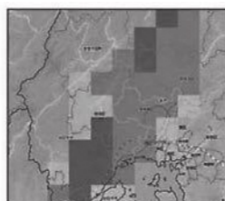
土砂災害警戒判定メッシュ情報