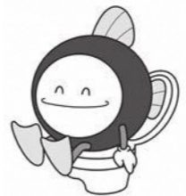
下水道マスコットキャラクター「スイスイ」

市内を流れる河川の水質改善など、市の良好な環境を守っていくため、ご協力をお願いします。