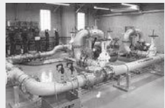
新しくなった施設

新施設は、地下水を取水して、遊離炭酸を除去する曝気処理や、クリプトスポリジウムなどの耐塩素性病原生物を不活性化する紫外線処理をして、より安全・安心な水道水を供給します。