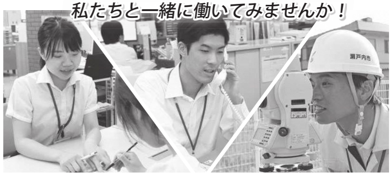
私たちと一緒に働いてみませんか!