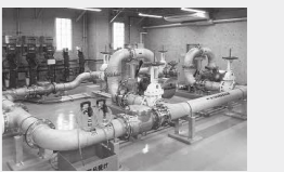
新しくなった施設

新施設は、地下水を取水して、遊離炭酸を除去する曝気処理や、クリプトスポリジウムなどの耐塩素性病原生物を不活性化する紫外線処理をして、より安全・安心な水道水を供給します。