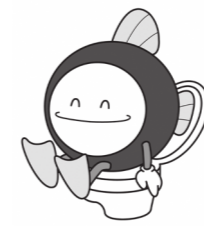
下水道マスコットキャラクター「スイスイ」

市内を流れる河川の水質改善など、市の良好な環境を守っていくため、ご協力をお願いします。