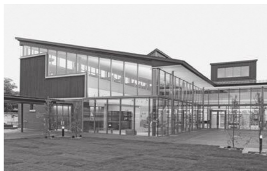
大賞を受賞した瀬戸内市民図書館

瀬戸内市民図書館もみわ広場が「ライブラリー・オブ・ザ・イヤー2017」において大賞を受賞しました。また、最終選考会の来場者の投票により決定される、オーディエンス賞も併せて受賞しました。