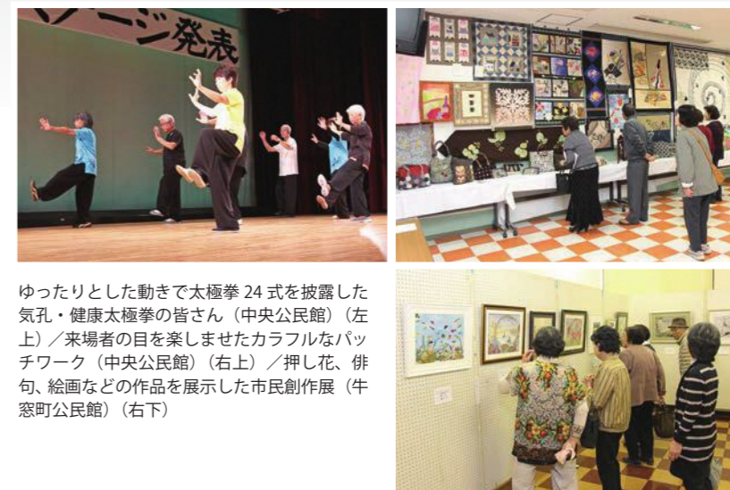
ゆったりとした動きで太極拳24式を披露した気孔・健康太極拳の皆さん（中央公民館）（左上）／来場者の目を楽しませたカラフルなパッチワーク（中央公民館）（右上）／押し花、俳句、絵画などの作品を展示した市民創作展（牛窓町公民館）（右下）

また、長船町公民館で開催された第31回備前長船菊花展では、市内外の菊づくり講座受講生や愛好家の皆さんが育てた菊が展示され、来場者を魅了しました。