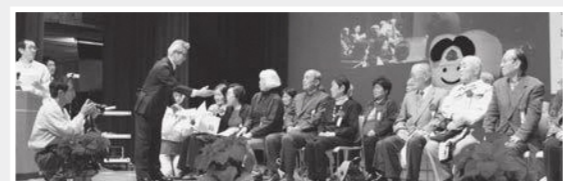
毎年、せとうち保健福祉フェスタ(表紙参照)では、瀬戸内市歯科医師会が80歳で20本以上自分の歯がある人を表彰しています