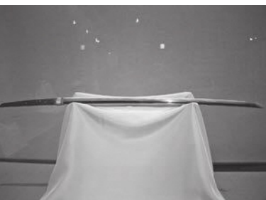
備前水田住大月八朗左國重（新見美術館蔵）

テーマ展では、贈答用として日本刀制作を担った備前中国の水田国重など有名な刀匠の11口の刀剣を中心に、朝鮮通信使関連の文書や資料などを展示し、当時の日韓の文化交流の様子を紹介しています。