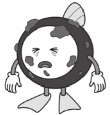
下水道マスコットキャラクター「スイスイ」