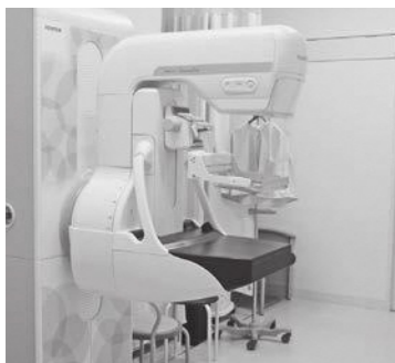
市民病院に設置されたマンモグラフィ

人間ドックや各種健康診断と組み合わせる受診も含め、市民の皆さんに周知するとともに、健康増進に向けた健診事業を充実していきます。