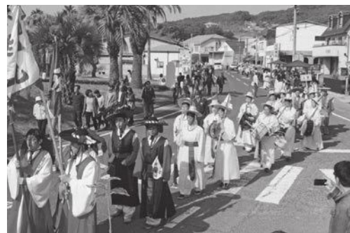
約200人が参加し、華やかな衣装で行進した通信使行列

ある韓国密陽市、長崎県対馬市、日韓共同申請の韓国側団体である釜山文化財団などをお迎えし、世界記憶遺産登録決定の冠を掲げた瀬戸内牛窓国際交流フェスタ2017が開催されました。 世界記憶遺産登録の影響もあり、マスコミの取材なども多くあり、また通信使行列の沿道も例年より多くの人でにぎわいました。