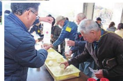
包装食袋に米を詰める参加者

消防本部で12月9日、自主防災組織の結成、活動活性化の中心を担う防災リーダーを育成するため、「せとうち防災リーダー研修会」が行われました。