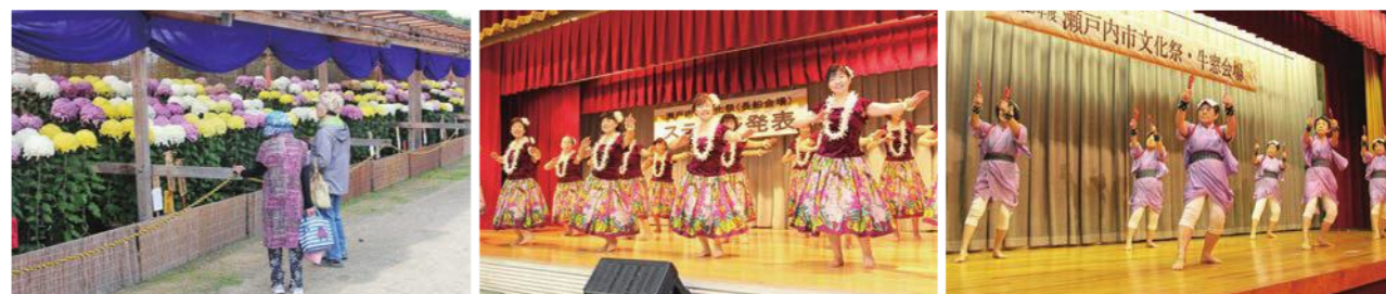
見事な咲きぶりで来場者を魅了した備前長船菊花展（長船町公民館）（左）／華やかな衣装でフラダンスを踊ったフラおさふねの皆さん（長船町公民館）（中）／息の合った踊りを披露した千手銭太鼓やまびこの皆さん（牛窓町公民館）（右）