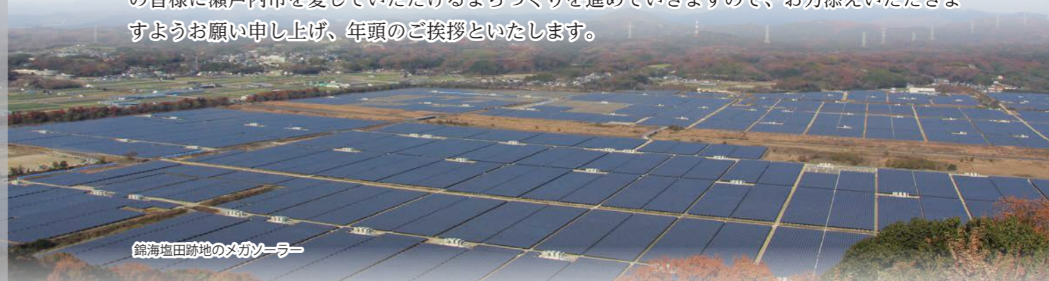
錦海塩田跡地のメガソーラー

これからも市の健全な財政を維持しながら、子育て支援、教育をはじめとした人づくりに力を入れるとともに、地域の経済やコミュニティがより元気になるための仕組みをつくり、市民の皆様が瀬戸内市を愛していただけるまちづくりを進めていきますので、お力添えいただきますようお願い申し上げます、年頭のご挨拶といたします。