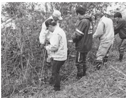
集落柵を設置する地域の皆さん

また、作付している田畑を獣害などの被害から守る目的で設置する「電気柵」や「金網」などの購入費の一部を補助していますが、被害軽減や経済的負担軽減を考慮すると、個人による柵の設置より、集落全体で取り組む「集落柵」がより効果的かつ効率的であることから、集落柵の設置に向けた働きかけを進めるとも