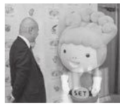
市長にも順位を報告

応援していただいた皆さんのおかげで過去最高位を獲得することができました。本当に応援ありがとうございました。