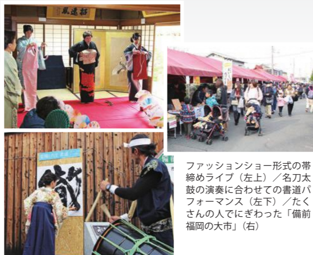
ファッションショー形式の帯締めライブ（左上）／名刀太鼓の演奏に合わせての書道パフォーマンス（左下）／たくさんの人でにぎわった「備前福岡の大都市」（右）

また、11月26日には、備前福岡の市場小路一帯で恒例の「備前福岡の大都市」が開催されました。妙興寺から延びる通りなどで住民団体らが郷土料理や特産品などを販売し、朝からたくさんの買い物客でにぎわいました。