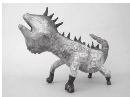
坂田源平「イグアナ」2015年

▽開催期間 平成30年1月19日(金)～2月12日(月・祝) ※期間中の休館日は、平成30年1月22日(月)、29日(月)