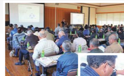
三角巾を使用した応急法や避難所運営についての講義もありました