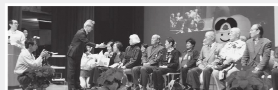
毎年、せとうち保健福祉フェスタ(表紙参照)では、瀬戸内市歯科医師会が80歳で20本以上自分の歯がある人を表彰しています