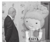
市長にも順位を報告

応援していただいた皆さんのおかげで過去最高位を獲得することができました。本当に応援ありがとうございました。