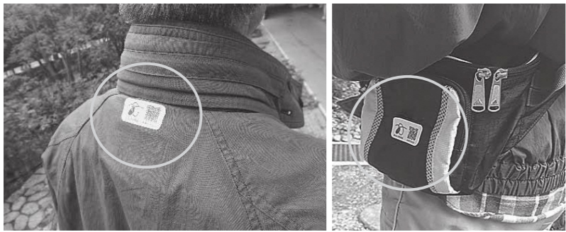
見守りシールを貼った例(左写真:服に貼ったもの、右写真:かばんに貼ったもの)

見守りシールをつけて、徘徊と思われる行動をとっている人を見かけたら、声掛けやQRコードの読み取りによるご協力をお願いします。 なお、見守りシールの活用を希望する人は、いきいき長寿課までお問い合わせください。