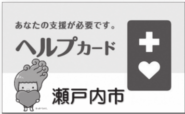
ヘルプカード(瀬戸内市版)

かりにくい人が、周囲に配慮を必要としていることを知らせるためのマークです。 ヘルプカードは、いざというときに手助けしてもらいたいことや自分の情報(障害などの特性や連絡先など)を記載するカードです。身につけておくことで、困ったときに周囲に手助けをお願いしやすくなります。