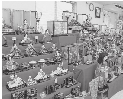
平成 29 年のおひなさまフェスタ

おひなさまフェスタ 瀬戸内市消費生活問題研究協議会 邑久グループでは、次のとおり「おひなさまフェスタ」を開催します。 木切れや包装紙を使っておひなさまを手作りする体験コーナーや、手作りクッキーとコーヒートの無料接待のカフェもあります。 さまざまな年代の歴史あるおひなさまや、会員が余った布で作ったかわいい吊り下げ飾の展示もしています。 リサイクルを考えながら、桃の節句を楽しみましょう。 ▽場所 リサイクルプラザ・おく(邑久町尾張483-6)