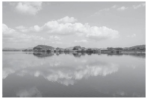
美しい水環境を守りましょう

ひとたび水質事故が発生すると、その対応にかかった費用は原因者が負担することとなり、農業や漁業などへ被害が及んだ場合、多大な賠償を請求されることもあります。農薬類や燃料(油類)の取り扱いには十分注意し、燃料