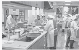
栄養バランスを考えて調理実習!