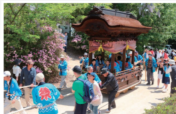
地域の人たちに引かれ、練り歩く円張だんじり