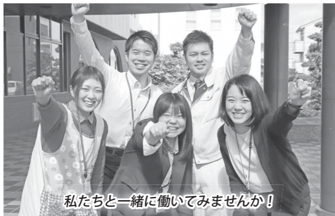
私たちと一緒に働いてみませんか!