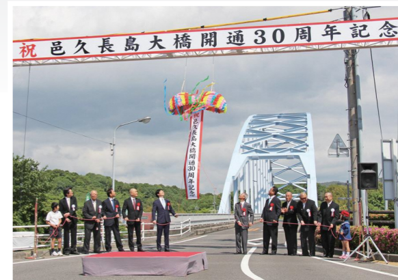
くす玉を割って、開通30周年を祝いました