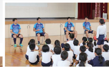
4人のコーチに普段聞けない質問をする児童