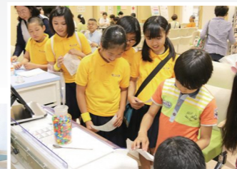
薬の代わりにお菓子を使用した分包体験