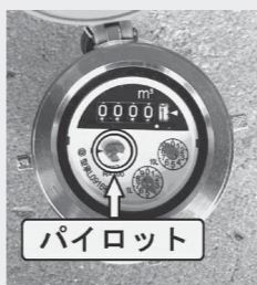
パイロット 水道メーターの自主点検を行いましょう

ただし、地下や壁の中での漏水の場合、指定工事店が修理すると、使用水量認定(減量)の対象となることがありますので、水道業務課へご相談ください。なお、指定工事店以外の業者や個人で修理した場合は対象になりません。 平素から水道メーターの自主点検を行い、漏水の早期発見に努めましょう。 ・料金、使用水量認定については