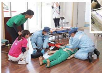
応急処置をテーマにした寸劇