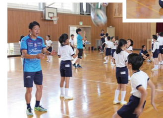
ボールを受け取る前に、手をたたくなどの動作を入れたキャッチボール