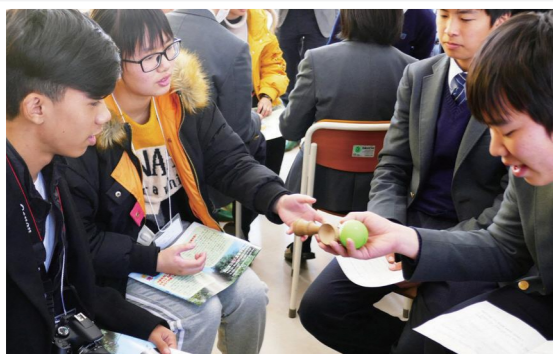
邑久高校の学生から「けん玉」の説明を聞く中国とミャンマーの学生（写真左2人）

「日本・アジア青少年サイエンス交流事業」（国立研究開発法人・科学技術振興機構が実施）に参加している中国とミャンマーの高校生10人が2月24日から3月2日まで瀬戸内市に滞在しました。