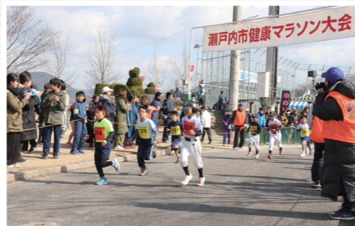
快走する小学生ランナー

また、ゴール後は、「かぼちゃの会」の皆さんが作る、地元産の野菜やカキなどがたっぷり入った「ハッスル鍋」が振る舞われました。