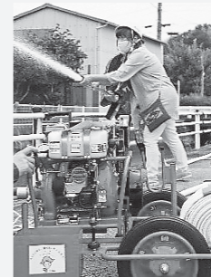
ポンプを使った放水訓練