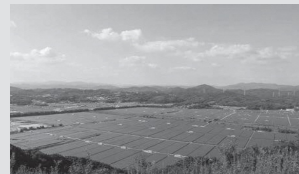
瀬戸内 Kirei 太陽光発電所