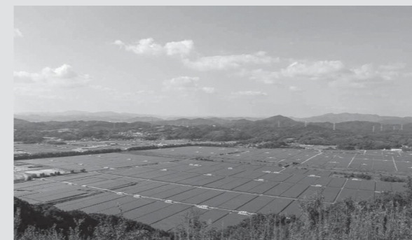
瀬戸内 Kirei 太陽光発電所