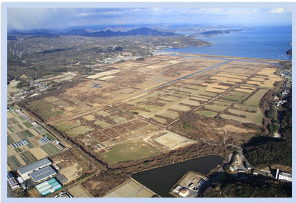
写真：錦海塩田跡地全景（平成 24 年撮影）