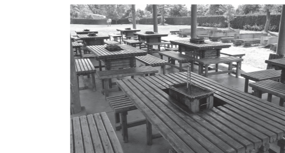
バーベキュー広場