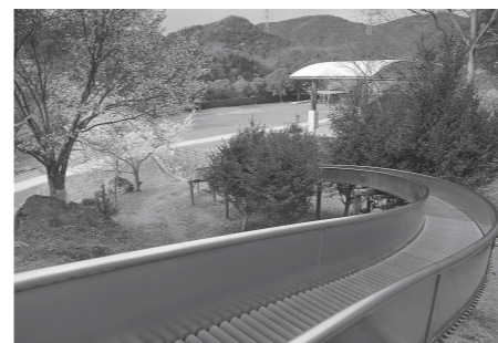
ローラーライダー