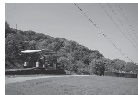
思いっきり遊べる芝生の広場