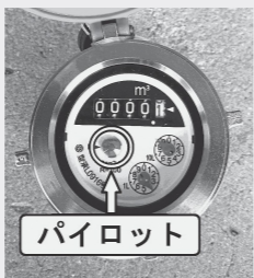
水道メーターの自主点検を行いましょう

ただし、地下や壁の中での漏水の場合、指定工事店が修理すると、使用水量認定(減量)の対象となる場合がありますので、水道業務課へご相談ください。