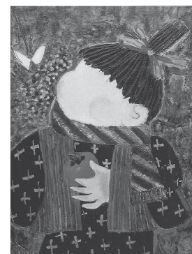
ベル串田「若草日記」1979年

300円、中学生以下無料 【以下、展覧会共通】 ▽ 開館時間 午前9時～午後5時(入館は午後4時30分まで) ▽ 休館日 7月5日(月)、12日(月)、26日(月) ※20日(火)～23日(金)は展示替えのため休館。 ※なお、新型コロナウイルス感染症拡大防止のため、展覧会の開催期間を変更したり美術館を閉館したりする場合があります。当館ホームページおよびSNSにてお知らせしますので、ご確認ください。 岡山県で生まれ、二科会に所属し活躍した洋画家のベル串田(1913-1994)。ベル串田は国内だけでなく、フランス芸術文化勲章を受章するなど、海外でも評価されました。 本展は、岡山に残る作品約60点や遺品を展示し、60年にわたる画業を顕彰する回顧展です。世界を魅了したベル串田の生涯をご覧ください。 ▽ 開催期間 7月24日(土)～8月8日(日) ▽ 観覧料 一般400円、団体(20人以上)・65歳以上