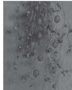
高島野十郎「からすうり」

▽ 開催期間 7月24日(土)～8月8日(日) ▽ 観覧料 一般400円、団体(20人以上)・65歳以上