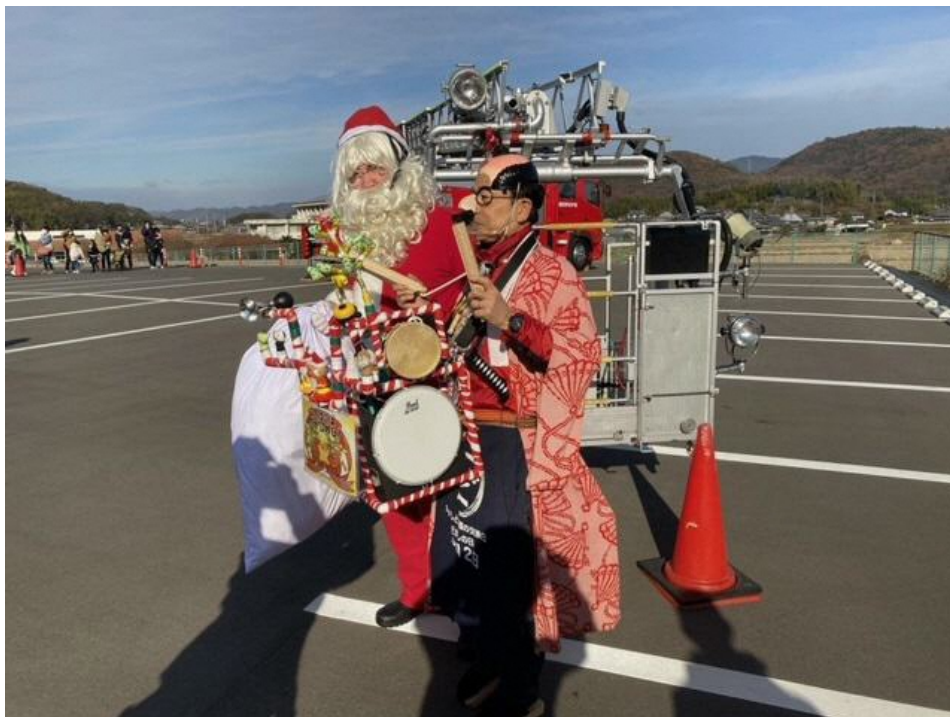
大町での防火防災啓発活動