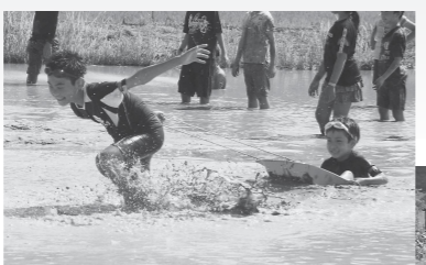
検温や運動時以外のマスク着用など、感染症対策を講じた上で開催されました。