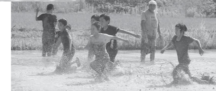
バットに向かってまっしぐら!