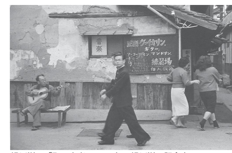
緑川洋一「町の音楽」1956年 緑川洋一記念室

体(20人以上)・65歳以上300円、中学生以下無料 ▽場所 瀬戸内市立美術館 ▽開館時間 午前9時~午後5時(入館は午後4時30分まで) ▽休館日 毎週月曜日(9月20日を除く)、9月21日(火)、24日(金)