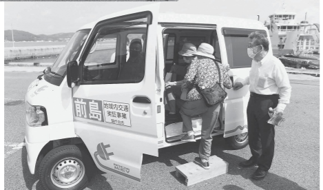
前島バスに乗車する前島住民

市では、8月から牛窓町前島地区で、島民の自宅とフェリー乗り場(前島側)間を電気自動車で送迎する新たな交通実証事業を開始しました。これは、運転免許証を保有していない高齢者などの前島住民が、本土側へ出向いて買い物をしたり通院したりしやすくすることを目的としています。