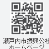
瀬戸内市振興公社 ホームページ