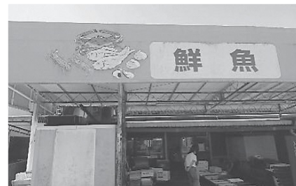
金寿丸 (鮮魚直売所)