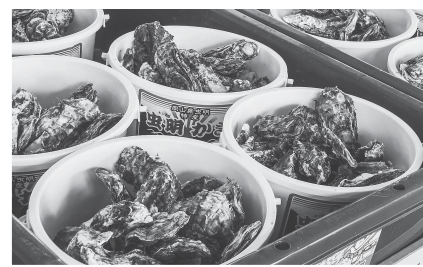
かき専門店 (邑久町漁業共同組合)

また、ギャラリーでは、年間を通してさまざまなジャンルの作品の展示・即売会を開催しています。展示内容については、ホームページで最新情報を確認してください。 鮮魚直売所「金寿丸」では、瀬戸内海で獲れた新鮮な海の幸を購入できます。 屋外には、バッテリーカーやすべり台、本格的なラジコンサーキットがあり、夏には水深45センチのプールやウォータースライダーがオープンするなど、小さなお子さんも存分に楽しめます。