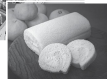
瀬戸内みかんロールケーキ