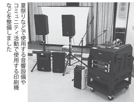
夏祭りなどで使用する音響設備や コミュニティ活動で使用する印刷機 などを整備しました。