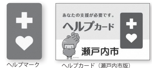
ヘルプマーク ヘルプカード(瀬戸内市版)

「障害者週間」に合わせてヘルプマークとヘルプカードをご紹介します。 ヘルプマークは、援助や配慮が必要なことが外見から分かりにくい人が、周囲に配慮を必要としていることを知らせるためのマークです。ヘルプカードは、いざというときに手助けしてもらいたいことや自分の情報(障がいなどの特性や連絡先など)を記載するカードです。身に付けておくことで、困ったときに周囲に手助けをお願いしやすくなります。 ヘルプマークやヘルプカードを身に付けた人を見かけたら、公共交通機関で席を譲る、困っているようであれば声をかけるなど、思いやりのある行動をお願いします。 ▷対象者 義足などを使っている人や内部障がいの人、妊娠初期の人など、援助や配慮を必要としている人 ▷交付および申請場所 福祉課(ゆめトピア長船)、市民課、牛窓支所、裳掛出張所 ▷費用 無料