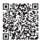
イベントの詳細や申し込みはこちら

▽日時 11月26日(金) 午前10時～午後2時30分 ▽場所 ゆめトピア長船 ※無料で託児所を利用できます。利用を希望する人は、事前にご予約ください。