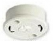
丸型フル引掛 シーリング