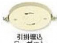
引掛埋込 ローゼット 引掛露出 ローゼット