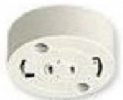
丸型 引掛シーリング