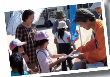
パンフレットを配布して啓発活動

起震車・はしご車での体験コーナー、紙食器づくりコーナーなどを設け、水消火器のあてなどのゲーム遊び、阪神淡路大震災のパネル写真展、非常持ち出し品・非常食の展示なども行いました。子どもから高齢者までの参加者が、楽しみながら防災意識を高揚することができました。