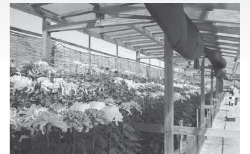
菊花展会場の様子

また、11月16日には表彰式が行われ、受賞者へ農林水産省農産局長賞や岡山県知事賞などの名誉ある賞が送られました。