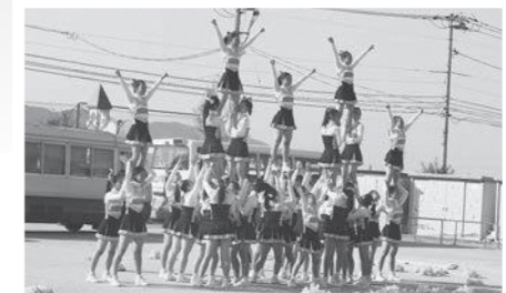
アクロバティックな演技は圧巻

コロナ禍で多くのイベントが中止になってしまった園児たちを元気付けようと、和太鼓部、チアリーディング部合わせて約70人も部員が参加。和太鼓部の演奏では、太鼓から響く大きな音に驚きながらも、音に合わせて手を叩いたり体を揺らしたりして、園児たちは迫力のある演奏を楽しんでいました。また、続いて行われたチアリーディング部の演技では、プロさながらのアクロバティックな動きに園児たちの目はくぎ付けに。軽やかに宙を舞い、笑顔で次々とポーズを決める姿に、会場は大きな拍手に包まれました。