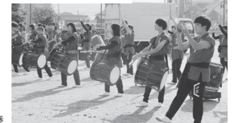
迫力ある和太鼓の演奏