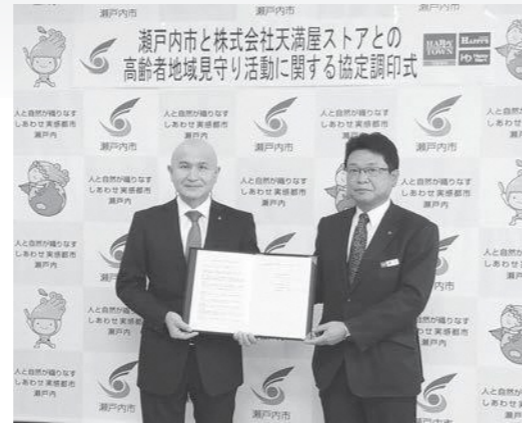
協定調印式の様子