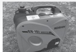
助成金を活用して整備された発電機やテント