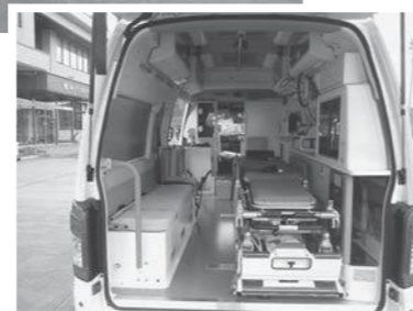
更新配備された高規格救急車(車内の様子)