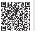
追加接種用接種券の発行手続き

他の自治体で新型コロナワクチンを2回接種した後に瀬戸内市へ転入した人は、当市で接種履歴が確認できないため、追加接種用の接種券が送付されない場合があります。2回目接種完了後に当市へ転入した人や2回目接種完了から8カ月経っても接種券が届かない人は、接種券の発行手続きをしてください。