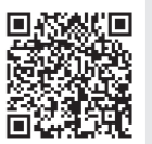
岡山県 共通予約システム