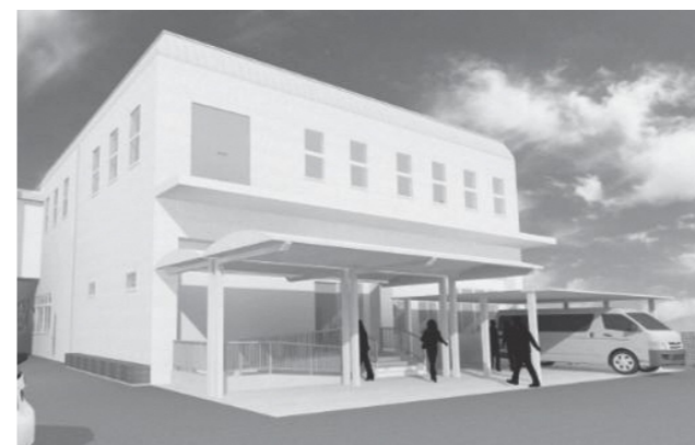
福祉部、こども・健康部が移転する本庁舎西棟（イメージ図）

現在、ゆめトピア長船内にある福祉部、こども・健康部は、本庁舎西棟1階を改修して移転します。移転後のゆめトピア長船は、改修した上で公民館として利用します。