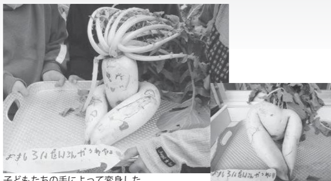
子どもたちの手によって変身した「大根ちゃん」