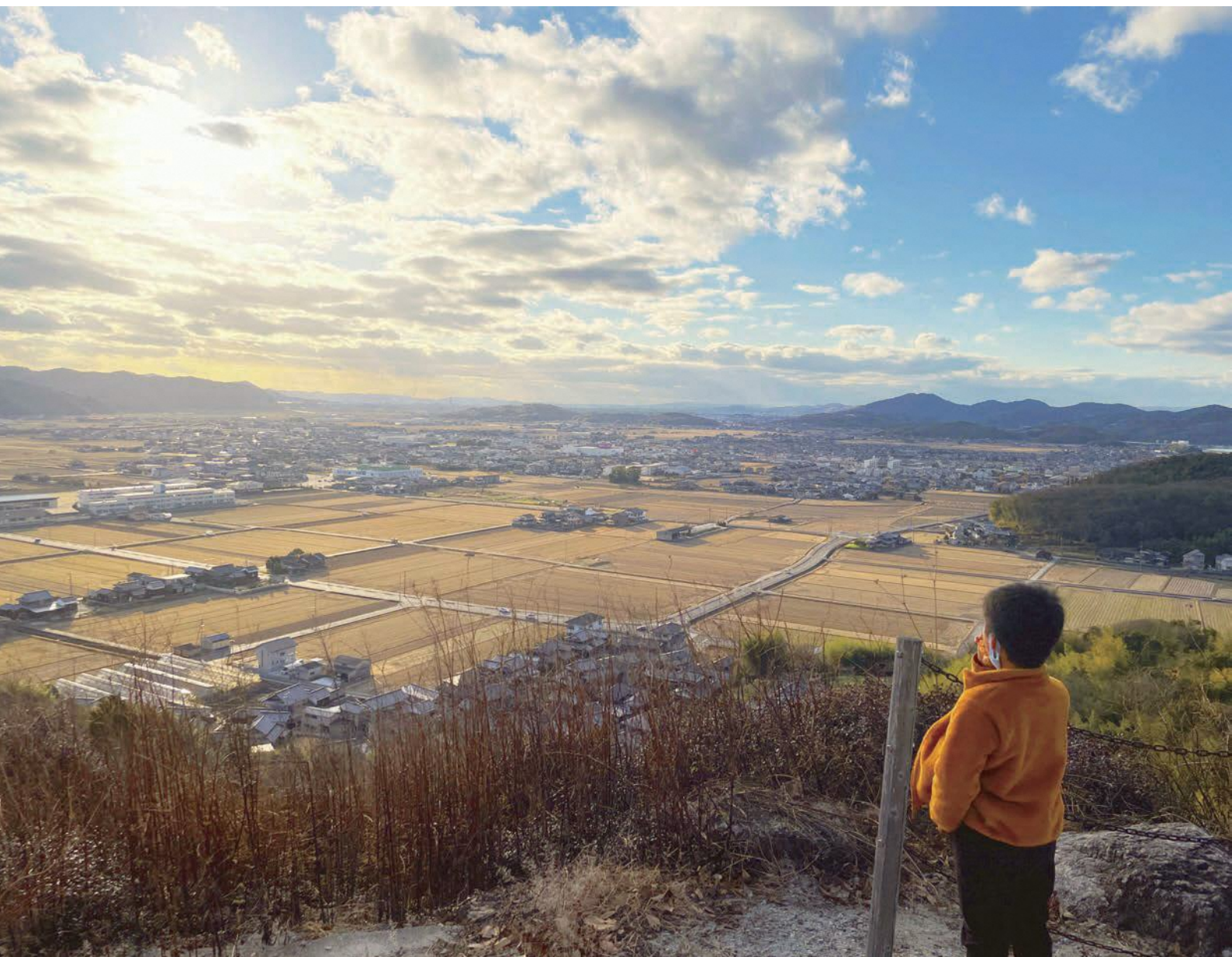
【表紙写真】千町平野(邑久町)