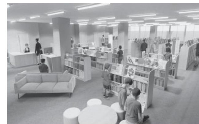
改修後のゆめトピア長船に整備する図書館（イメージ図）