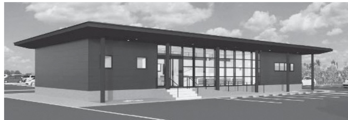
新築する長船支所（イメージ図）

長船支所は、現在の長船支所東側駐車場に新築移転し、だれでもトイレ（多目的トイレ）やキッズスペースなどを設置します。