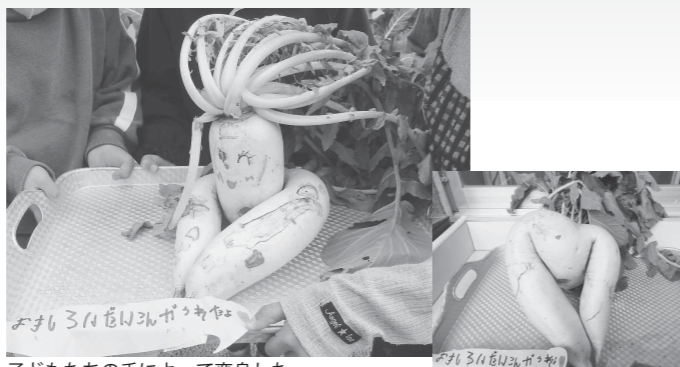
子どもたちの手によって変身した「大根ちゃん」