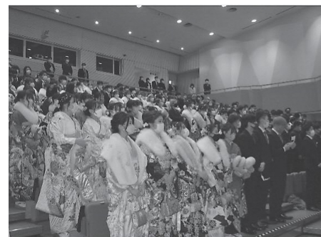
令和4年成人式の様子