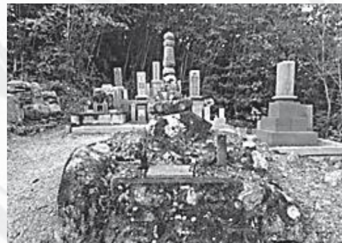
上山田の児島高德墓所

児島高德は、鎌倉幕府との戦いに敗れ、隠岐の島に流される後醍醐天皇を、兵庫県と岡山県の県境に近い船坂山で奪回しようとした。その後、天皇が宿泊していた津山市院庄の館(現在の作楽神社)の桜の木に、天皇を慰める詩を刻んだと言われています。天皇が隠岐の島を脱出し