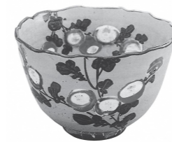
茶陶として人気のある虫明焼。中央公民館1階の「虫明焼展示室」で見ることができます。 ▲清風与平作 江戸後期