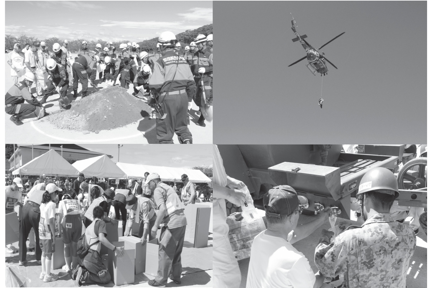
令和元年瀬戸内市総合防災訓練の様子