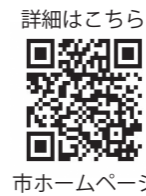
詳細はこちら 市ホームページ

購入・設置にかかる費用の2分の1以内（上限5万円、千円未満の端数は切り捨て） ※国の補助金制度を併用する場合は、補助を受けた後の費用を対象経費とします。