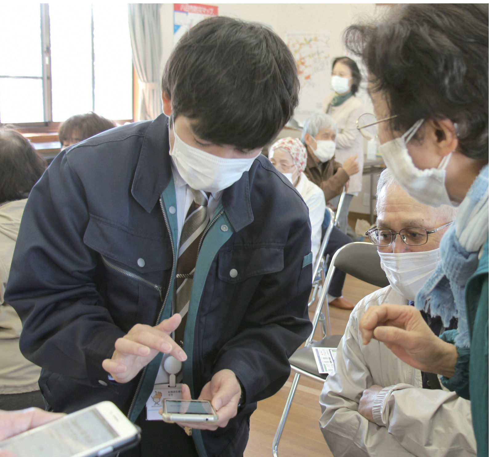
【表紙写真】八日市自治会にて瀬戸内市防災アプリを登録する様子