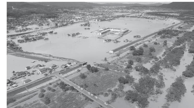
平成 30 年 7 月豪雨災害（倉敷市真備町）での浸水被害