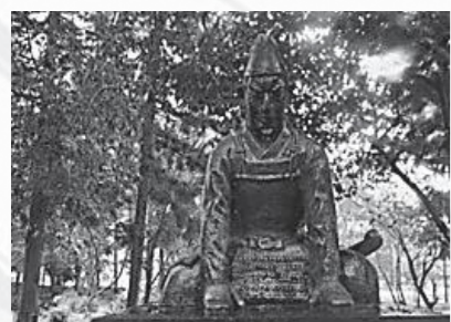
津山市「作楽神社」児島高德像