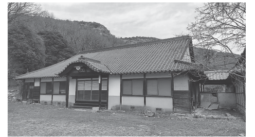
千力山のふもとにある伊木家ゆかりの興禅寺(駐車場利用可)