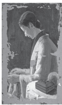
興梧武「編みものする婦人」