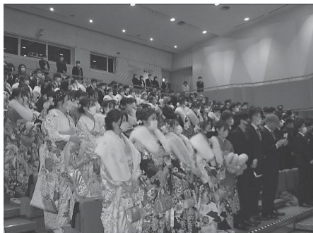
令和4年成人式の様子