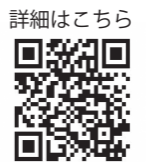
詳細はこちら 市ホームページ