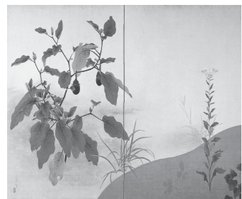
小野春男「屏風絵・茄子」(複製)

▽期間 5月17日(火)～7月10日(日) 〇覧料 一般800円、割引700円(団体20名以上または65歳以上)、オーブ会員(友の会)400円、