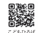
こどもひろば Facebook ページ