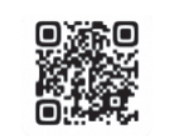
市ホームページ(子育て応援サイト)